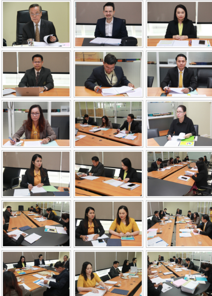
← สำนักงานมหาวิทยาลัย มสศ. จัดประชุมคณะกรรมการสรรหานายกสภามหาวิทยาลัย ครั้งที่ 1/2562