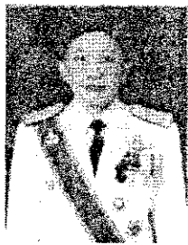
พลโทหญิง ดวงกมล สุคนธทรัพย์ อดีตรองผู้บัญชาการศูนย์รักษาความปลอดภัย กองบัญชาการกองทัพไทย