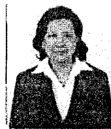
นางผาณิต นิตทัณฑ์ประภาศ อดีตประธานผู้ตรวจการแผ่นดิน และอดีตสมาชิกสภาปฏิรูปแห่งชาติ