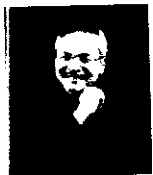
Directed by Stephen M Sano

โดยอันเชิญ 5 บทเพลงพระราชนิพนธ์ในสมเด็จพระปรมินทรมหาภูมิพลอดุลยเดช