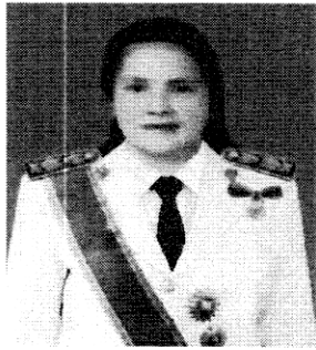
๑. นางยุพิน ชลานนท์นิวัฒน์ รองผู้ว่าการตรวจเงินแผ่นดิน (ด้านการตรวจเงินแผ่นดิน)

หากท่านผู้ใดมีข้อมูล ข้อเท็จจริง และข้อคิดเห็นเกี่ยวกับผู้ได้รับการเสนอชื่อ ให้ดำรงตำแหน่งกรรมการตรวจเงินแผ่นดิน :