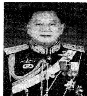
๔. พลเอก ชนะทัฬห อินทามระ อดีตผู้อำนวยการสำนักงานตรวจสอบภายใน ทหารบก (ด้านการตรวจสอบภายใน)