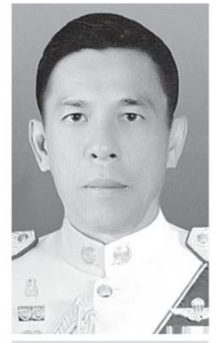
พล.ต.ท.ชาญเทพเสสะเวช