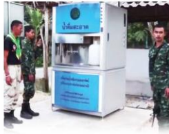
ตุ๊กกรองน้ำครึ่งล้าน! ฉุก(ละหุก)คิด ▶3

คอลัมน์: ฉุก(ละหุก)คิด: ตุ๊กกรองน้ำครึ่งล้าน!