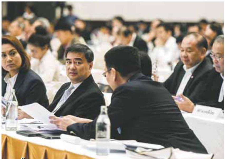
■ ฟังชี้แจง ■ ผู้แทนพรรคการเมืองเก่า 55 พรรค เข้ารับฟังการชี้แจงแนวทางการดำเนินกิจการของพรรคการเมืองจากคณะกรรมการการเลือกตั้ง ที่โรงแรมเซ็นทรา บายเซ็นทารา ศูนย์ราชการและคอนเวนชันเซ็นเตอร์ ถนนแจ้งวัฒนะ เมื่อวันที่ 28 มี.ค.

ส่วนผลการหารือพบว่า ทุกพรรคต่างแสดงความกังวลถึงการให้สมาชิกยื่นยันตัวตนด้วยเอกสารสำเนาบัตรประชาชน และสำเนาทะเบียนบ้าน รวมทั้งการ