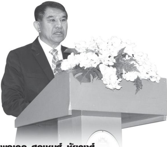
พลเอก สุรเชษฐ์ ชัยวงศ์ รัฐมนตรีช่วยว่าการกระทรวงศึกษาธิการ

ภายใต้การนำของ พลเอก สุรเชษฐ์ ชัยวงศ์ รัฐมนตรีช่วยว่าการกระทรวงศึกษาธิการ นำทีมภายใต้ร่วมบูรณาการขับเคลื่อนโครงการ “ไทยนิยม ยั่งยืน” ตามมติคณะรัฐมนตรี ไปสู่การปฏิบัติทั้งในส่วนกลาง และในระดับพื้นที่ทั่วประเทศ โดยมีมอบหมายให้ กคณ.ตำบล ในฐานะหน่วยงานแนวหน้าที่อยู่ใกล้ชิดประชาชนที่สุด ร่วมเป็นทีมขับเคลื่อนฯ โครงการไทยนิยม ยั่งยืน ระดับตำบล ทำหน้าที่จัดเตรียมข้อมูลพื้นฐานของตำบล โดยศึกษาและทำความเข้าใจรายละเอียดโครงการ และกรอบหลักการในการดำเนินการ เพื่อการมีส่วนร่วมในการพัฒนาประเทศสู่ความยั่งยืนทั้ง 10 เรื่อง ได้แก่ ดังนี้ 1. “สัญญาประชาคมผูกใจไทยเป็นหนึ่ง” เน้นสร้างความสามัคคีปรองดอง 2. “คนไทยไม่ทิ้งกัน” ด้วยการดูแลผู้มีความเสี่ยง โดยเฉพาะผู้ลงทะเบียนในโครงการสวัสดิการแห่งรัฐ 3. “ชุมชนอยู่ดีมีสุข” มุ่งพัฒนาอาชีพเสริมรายได้ให้ประชาชน 4. “วิถีไทยวิถีพอเพียง” ส่งเสริมการนำปรัชญาเศรษฐกิจพอเพียงใช้ในการดำเนินชีวิตทุกกลุ่มทุกช่วงวัย 5. “รู้สิทธิ รู้หน้าที่ รู้กฎหมาย” เน้นให้ประชาชนมีความรู้ในสิทธิ หน้าที่ และการเป็นพลเมืองที่ดี 6. “รู้กลไกการบริหารราชการ” ที่ต้องการให้ประชาชนเข้าใจการบริหารราชการทุกระดับ เพื่อมุ่งสร้างประโยชน์ให้ประชาชน