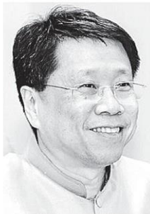
นพ.ธีระเกียรติ