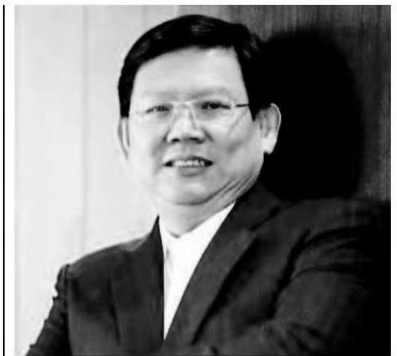
สุวิทย์ เมษินทรีย์

ทั้งนี้ นายกฯได้มอบให้นายกอบศักดิ์ ภู่ตระกูล รัฐมนตรีประจำสำนักนายกรัฐมนตรี ในฐานะประธานคณะกรรมการ ขับเคลื่อนการปฏิรูปประเทศดูแลเรื่องนี้ซึ่ง จากการหารือ นายกอบศักดิ์มองว่าดำเนินการ ได้ทันโดยอาจจะใช้เวลาประมาณ 2-3