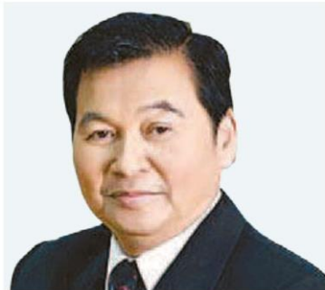
สุกুম เจลยทรัพย์