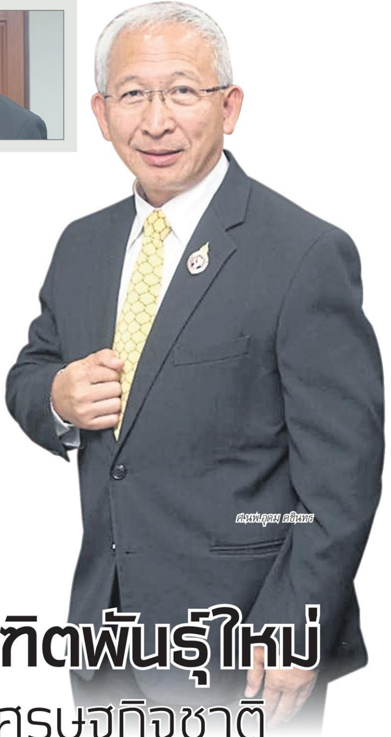
ศ.นพ.อุดม คชินทร

นพ.อุดม เปิดใจตั้งแต่เข้ามารับตำแหน่ง รมช.ศธ. ว่า รัฐบาลเห็นว่าการศึกษาระดับอุดมศึกษาเป็นหัวใจต่อการพัฒนาประเทศไทย จึงมีนโยบายชัดเจนที่จะยกระดับสำนักงานคณะกรรมการการอุดมศึกษา (สกอ.) เป็นกระทรวงการอุดมศึกษาแยกขาดจากกระทรวงศึกษาธิการ (ศธ.) โดยขณะนี้ได้ร่าง พ.ร.บ. การอุดมศึกษา ขึ้นมา 3 ฉบับเสร็จเรียบร้อย กำลังเสนอเข้าคณะรัฐมนตรี (ครม.) พิจารณา ก่อนผ่านกฤษฎีกาพิจารณาอีก 4 เดือน และผ่านสภานิติบัญญัติแห่งชาติ (สนช.) อีก 3 เดือน รวมประมาณ 7 เดือน