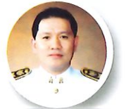
ยศพล เวณูโกเศศ

สวัสดีครับ มวลมิตรพี่น้องสมาชิกสหกรณ์ออมทรัพย์ข้าราชการกระทรวงศึกษาธิการ จำกัด ที่เคารพรักทุกท่าน ถ้าพูดถึงการเป็นหนี้แล้วผมคิดว่าหลายคนหรือทุกคนเลยคงไม่อยากจะเป็น แต่เมื่อเราตัดสินใจที่จะเป็นหนี้แล้ว ควรเลือกหนี้ที่จะสร้างอนาคตหรือความมั่นคงระยะยาว และหลีกเลี่ยงการก่อหนี้ที่ไม่ก่อให้เกิดรายได้เพิ่ม หรือไม่ได้ช่วยเพิ่มความมั่นคงทางการเงิน