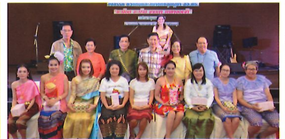
๒๑-๒๔ มิ.ย. ๖๑ - สอ.ศธ. จัดการประชุมสัมมนา "การเสริมสร้างความสัมพันธ์อันดีระหว่างสหกรณ์กับตัวแทนและสมาชิกกลุ่มผู้นำ" ณ โรงแรมแอมบาสซาเดอร์ ซิตี้ จอมเทียน จังหวัดชลบุรี