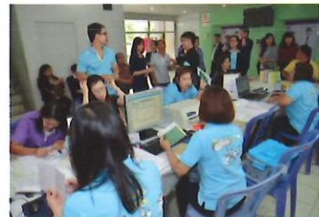
๘ ส.ค. ๖๑ - สอ.ศธ. จัดโครงการสหกรณ์สัญจรพบผู้บริหารและสมาชิก ณ มหาวิทยาลัยราชภัฏบ้านสมเด็จเจ้าพระยา