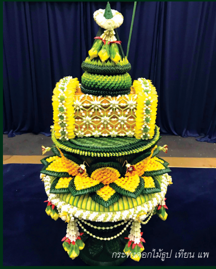
กระพวงดอกไม้รูปเทียนแพ