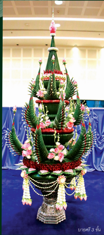
บายศรี 3 ชั้น