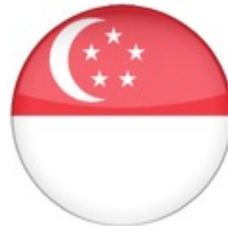
สิงคโปร์