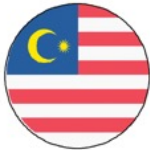
มาเลเซีย