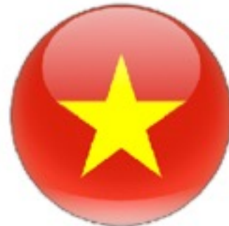
เวียดนาม