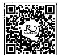
QR CODE สำหรับจองห้องพัก มหาวิทยาลัยศิลปากร

การสำรองห้องพัก ท่านสามารถจองห้องพักกับทางโรงแรมโดยสแกน QR-Code สำหรับจองห้องพัก หากท่านจองห้องพักภายหลังห้องพักอาจเต็มได้ และอาจจะไม่ได้ห้องพักราคาพิเศษซึ่งเป็นอัตราค่าที่พัก โรงแรมรอยัลริเวอร์ ๒๑๙ ซอยจรัญสนิทวงศ์ ๖๖/๑ แขวงบางพลัด เขตบางพลัด กรุงเทพฯ ๑๐๗๐๐ โทรศัพท์: ๐๒-๔๒๒-๙๒๒๒ โทรสาร : ๐๒-๔๓๓-๕๘๘๐ E-mail : rsvn@royalriverhotel.com