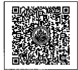
QR-Code เพื่อสมัครอบรม

ดาวน์โหลดรายละเอียดได้ที่ Website: www.thailocalsu.com