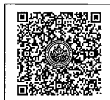
QR-Code เพื่อสมัครอบรม

โทรศัพท์ ๐-๒๑๐๕-๔๖๘๖ ต่อ ๑๐๐๒๖๖ โทรสาร ๐-๒๔๓๓-๔๙๓๘