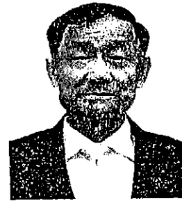
๖. พลเรือเอก ประสาน สุขเกษตร อดีตรองผู้บัญชาการทหารสูงสุด