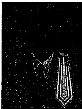
๓. นายราชศักดิ์ กุลละวณิชย์ ที่ปรึกษากฎหมายกรมคุ้มครองสิทธิและเสรีภาพ และทนายความ สำนักงานกุลละวณิชย์ทนายความ