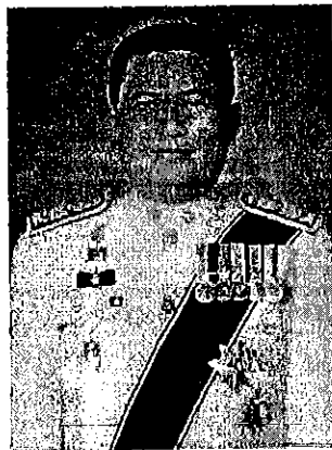
๓. นายมณฑิร เจริญผล รองผู้ว่าการตรวจเงินแผ่นดิน