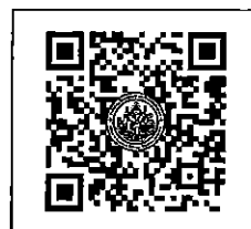
QR-Code เว็บไซต์