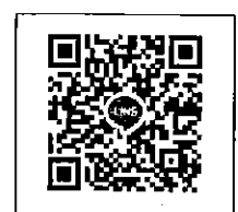
QR-Code เพื่อสอบถามข้อมูล