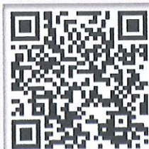
ดาวน์โหลดประกาศ