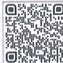
กรณีสสมัครด้วยตนเอง