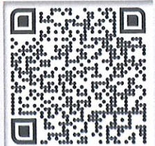
กรณีสเสนอชื่อ