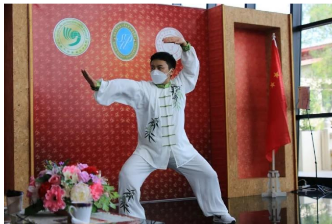
การแสดงไทเก๊ก