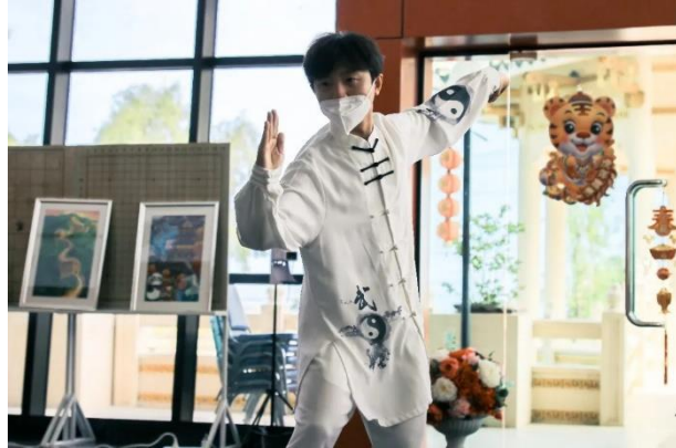
การแสดงกังฟู

การแสดงด้านวัฒนธรรมจีนของอาสาสมัครชาวจีน มี ๓ การแสดง