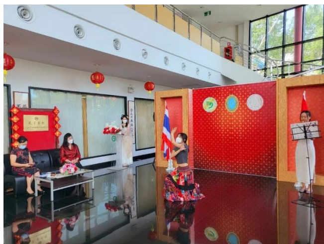
การแสดงระบำจีน