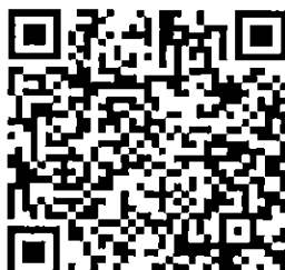
รายละเอียดหลักสูตร