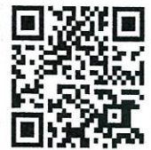
QR-Code แผ่นพับประชาสัมพันธ์