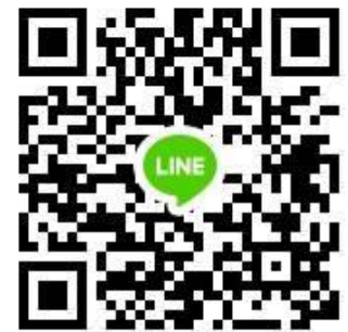
QR Code เข้ากลุ่มLine 134