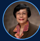
ศาสตราจารย์ ดร.บุญเรียง ขจรศิลป์