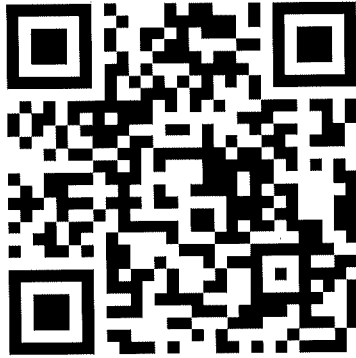
QR Code ระบบรับสมัคร กปน